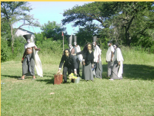
Fleurs de Silence