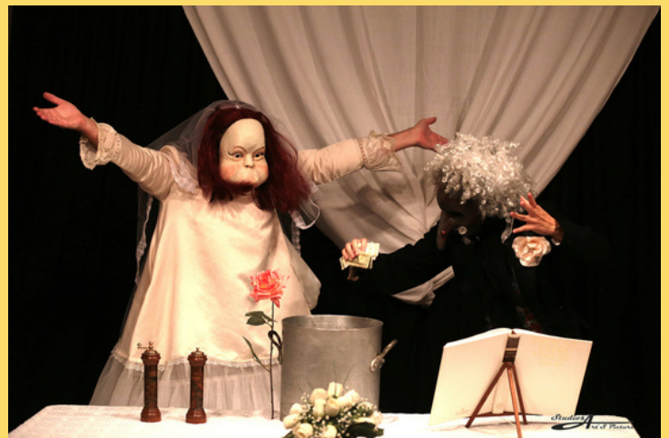
Le mariage ou comment les oiseaux sont indispensables aux hippopotames