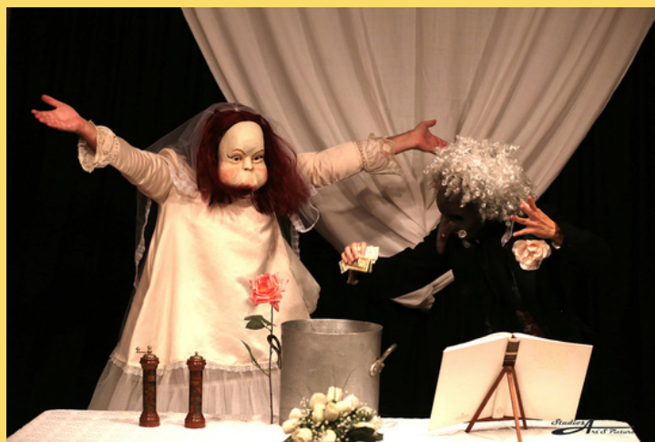
Le mariage ou comment les oiseaux sont indispensables aux hippopotames